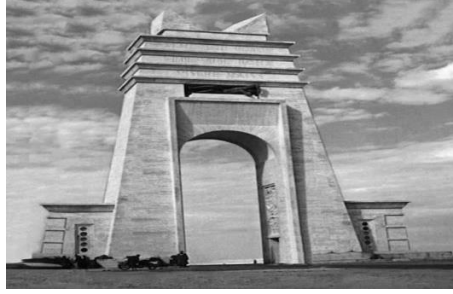
الشكل (7) يوضح قوس الاخوين فليبي

بذلك يؤكدون ملكيتهم للأرض من تلك الحقبة إي بذلك ملكيتهم لتاريخها، وأنهم بذلك لهم الحق باسترجاعها الشكل (7) [21].