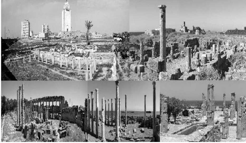
الشكل (1) يوضح معالم البيتابوليس

الثقافات الدخيلة المؤثرة على هوية تشكيل الفن المعماري الموروث في المجتمع الليبي