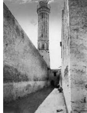
الشكل (3) يوضح السرايا الحمراء وجامع عثمان في العهد العثماني