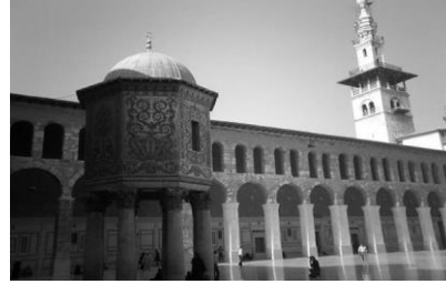
الشكل (14) بيت المال