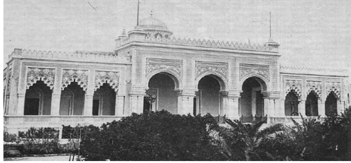
الشكل (12) يوضح برلمان برقة 1928 م.