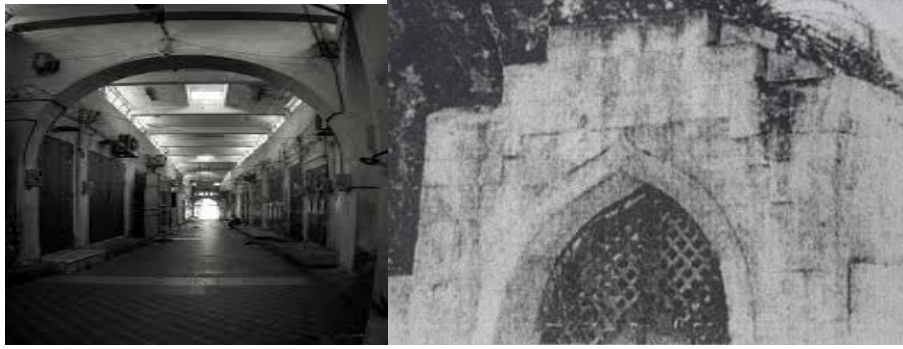
الشكل (6-أ) مدخل عثمان الشكل (6-ب) سوق النور عثماني