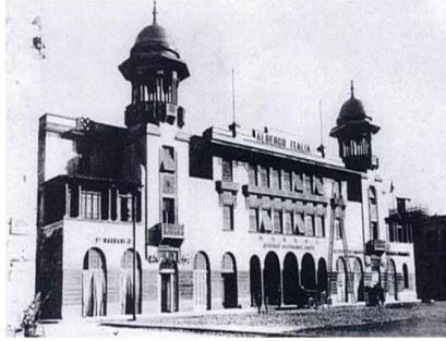
الشكل (16) فندق إيطاليا

القديمة، مبتكرين طراز إسلاميا مزيفا لا علاقة له بليبيا كما في الشكل (15) (مفتاح، 2018م).