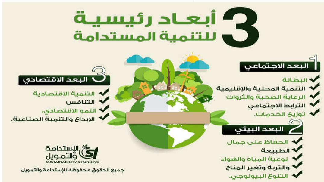
الشكل رقم (1): أبعاد التنمية المستدامة