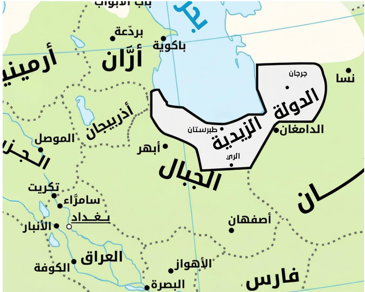
الشكل (2.3) 1

الدولة العلوية الزيدية في طبرستان (250-864/316-928م)