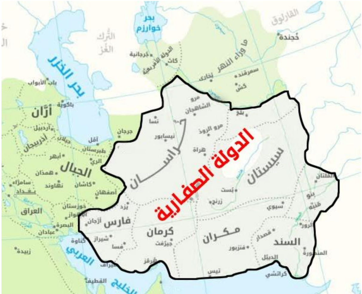
الشكل (2.5) 1

الدولة الصفارية (253 - 289 هـ / 867 - 902 م)،