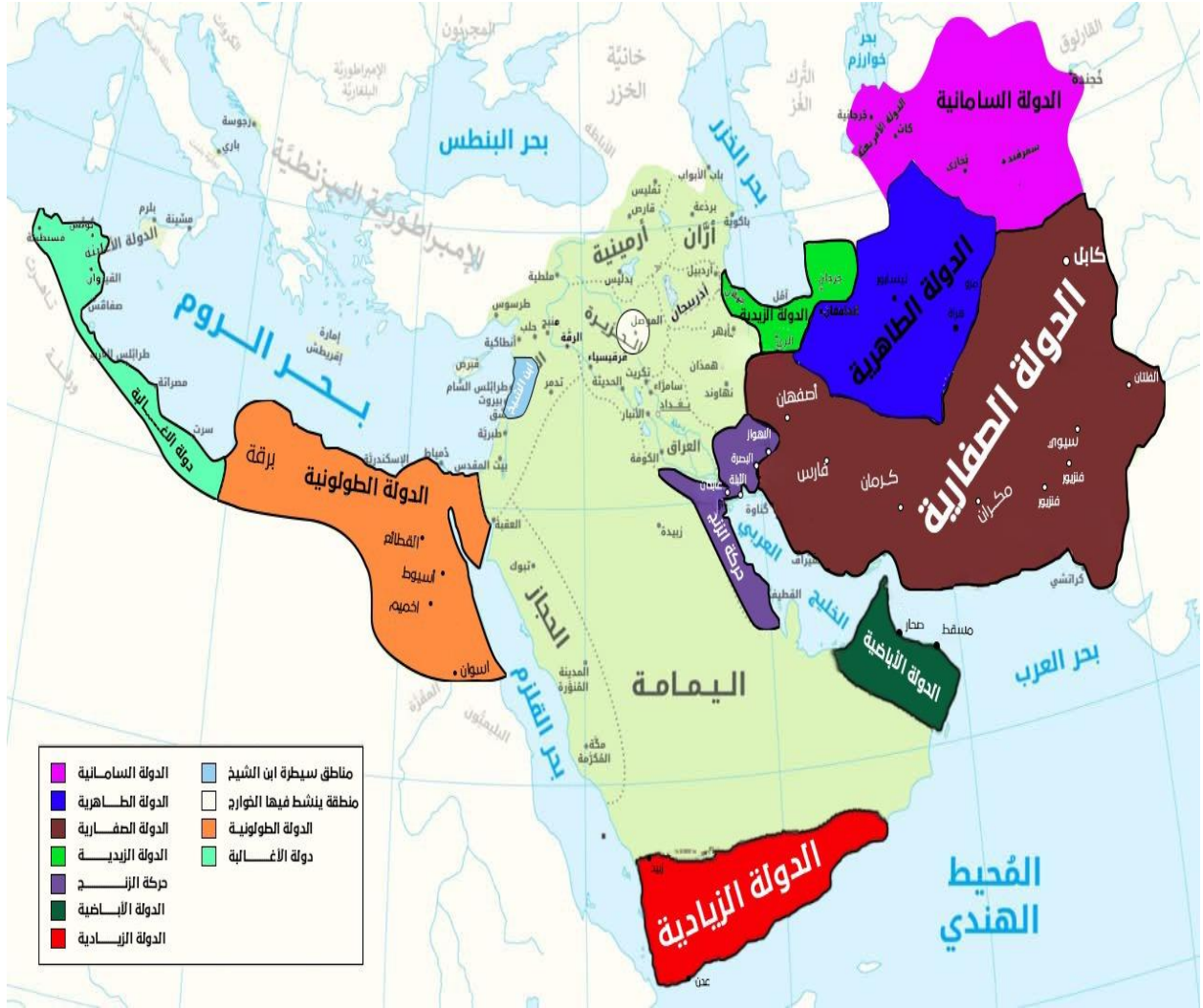
الشكل (2.1) 1

1 ( الخريطة من تصميم الباحث اعتمادا على كتاب أطلس تاريخ الدولة العباسية سامي بن عبدالله الملوغوث و أطلس التاريخ الاسلامي حسين مؤنس .