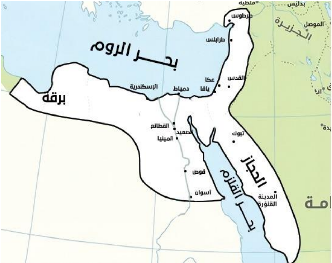
الشكل (2.2) 1

الدولة الطولونية (254 - 292 هـ / 868 - 905 م)،