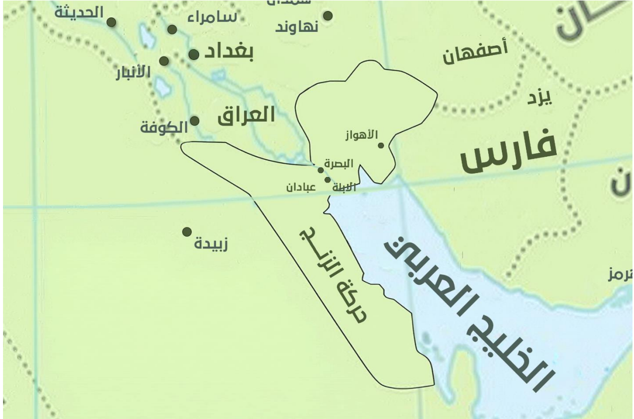
الشكل (2.4) 1

المناطق التي دخلت سيطرة الزنج (255 - 270 هـ / 869 - 883 م)،